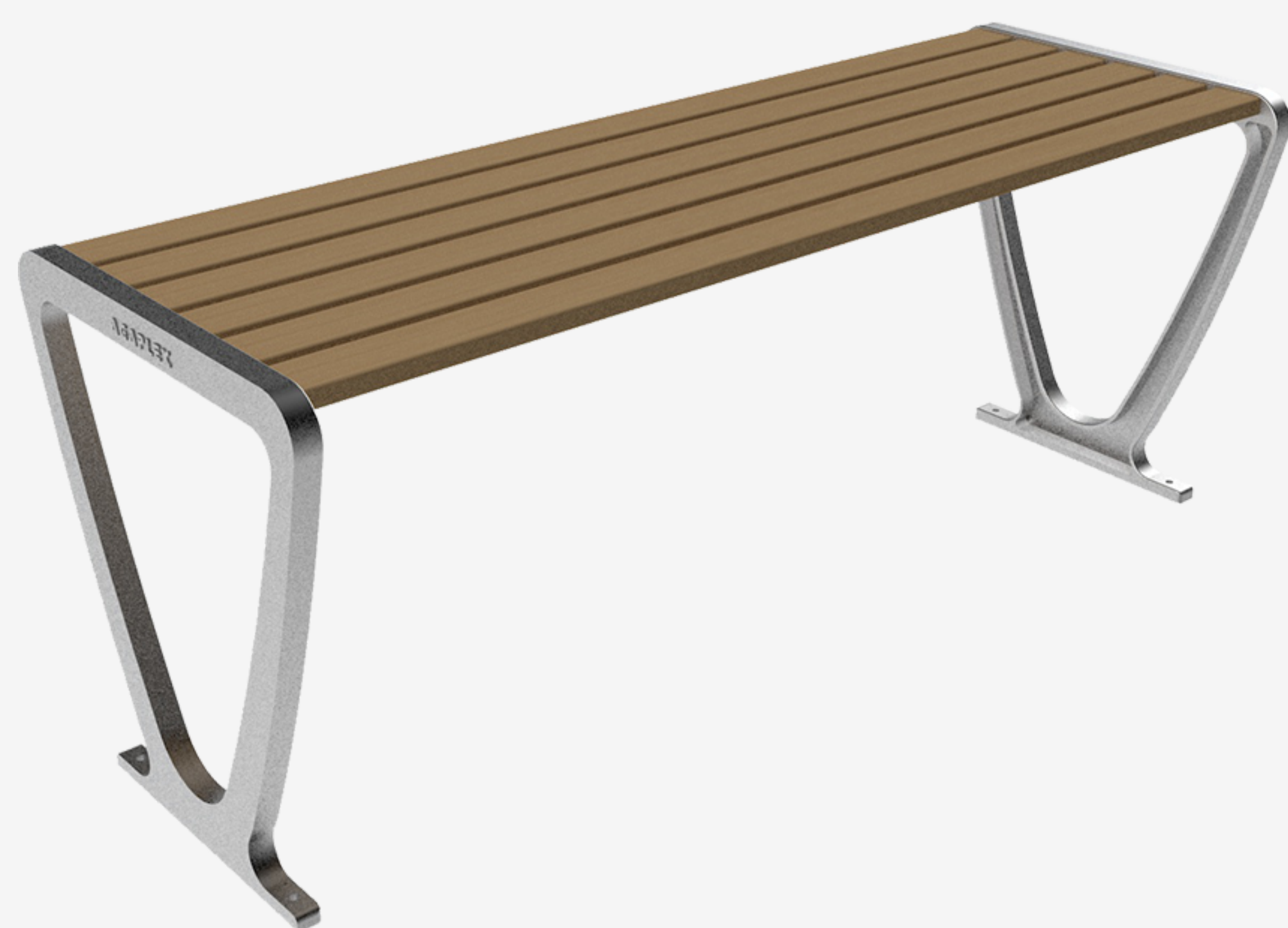
Table Du Parc Public Model d1